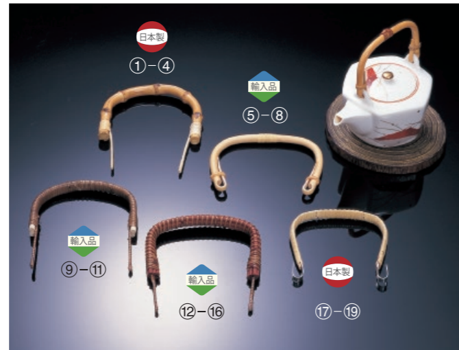
※これらの商品は天然素材を手作りで制作しております。そのため、各種サイズは前後することがございます。サイズは目安となりますので、予め、ご了承くださいませ。