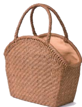
91938 山葡萄 8(網代編) ¥95,000 W23×D13×H24.5cm material/ 山葡萄 内布付 輸