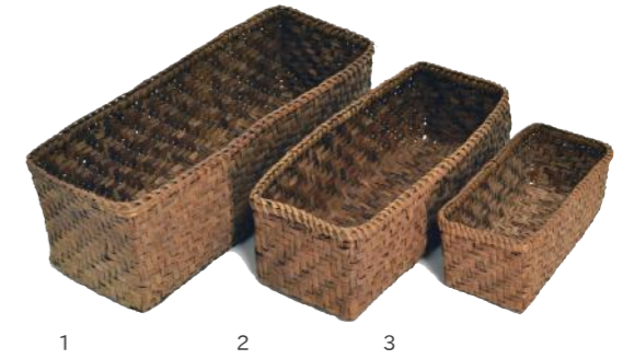
山葡萄バスケット 輸 material/ 山葡萄 1: 91479 大 ¥8,000 W36×D13×H12cm 2: 261847 中 ¥8,000 W29×D13.5×H10cm 3: 261847 小 ¥8,000 W18×D8×H8cm