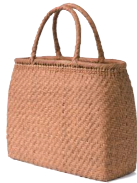
91935 山葡萄 4(網代編) ¥117,000 W31×D11×H24cm material/ 山葡萄 内布付 輸