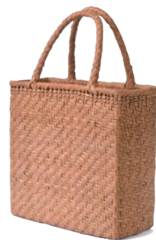
91936 山葡萄 5(網代編) ¥87,000 W23.5×D11×H23cm material/ 山葡萄 内布付 輸