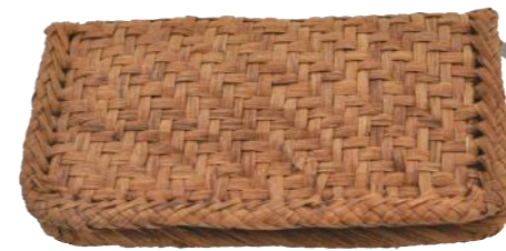
91485 山葡萄ウォレット ¥31,000 W22.5×D3.5×H12cm material/ 山葡萄 輸