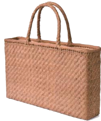
91934 山葡萄 3(網代編) ¥87,000 W22×D10×H21cm material/ 山葡萄 内布付 輸