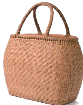
91937 山葡萄 7(網代編) ¥114,000 W37×D8×H22cm material/ 山葡萄 内布付 輸