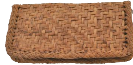
91485 山葡萄ウォレット ¥31,000 W22.5×D3.5×H12cm material/ 山葡萄 輸