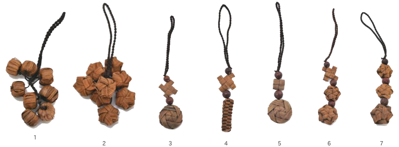
山葡萄ストラップ 輸 material/ 山葡萄 1: 91433 丸 ¥3,700 15cm 5: 91437 E ¥4,200 16cm 2: 91434 B ¥3,800 17cm 6: 91438 F ¥4,600 19cm 3: 91435 C ¥4,000 16.5cm 7: 91439 G ¥4,800 20cm 4: 91436 D ¥4,800 18cm