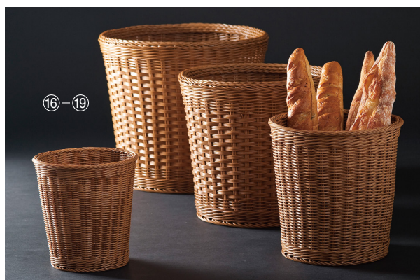
24-407-16 (59124) 樹脂手編スタンド バスケット(丸)(小)