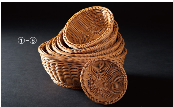
24-407-01 (59161) 樹脂手編バスケット (丸)(ミニミニ)(茶)