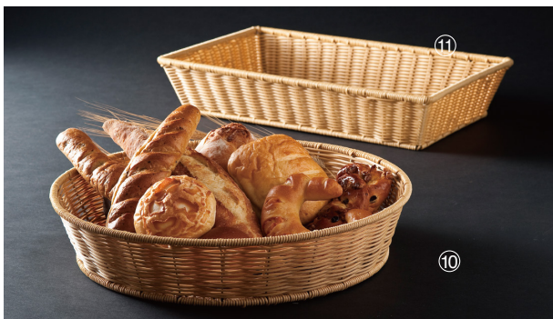
24-407-10 (59122) 樹脂手編ベーカリー トレー(丸)(特大)