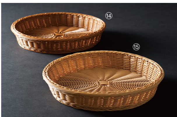
24-407-14 (59138) 樹脂手編丸ベーカリー トレー(白)