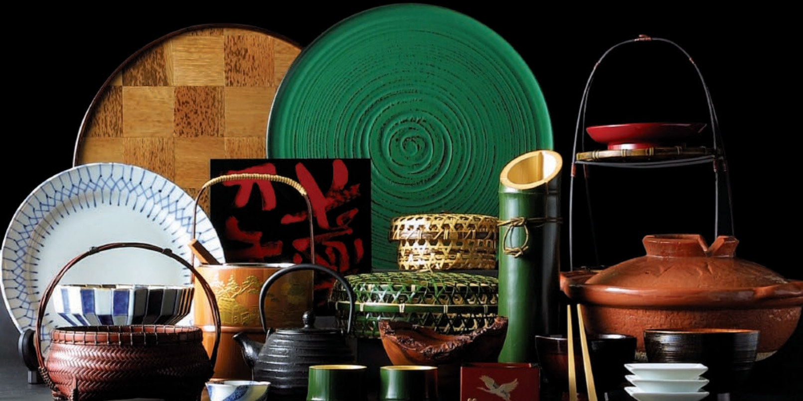
【海外情報誌EAT-JAPAN掲載】 年1回 Cross Media Ltd.発行