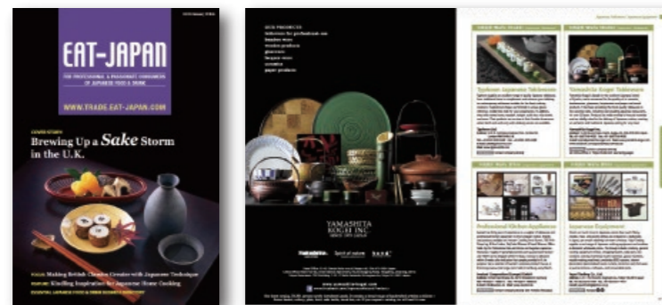
Information Magazine EAT JAPAN Web page