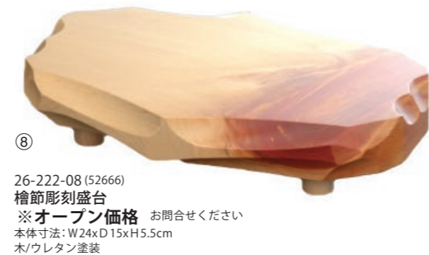
26-222-08 (52666) 檜彫彫刻盛台 ※オープン価格 お問合せください 本体寸法: W24xD15xH5.5cm 木/ウレタン塗装