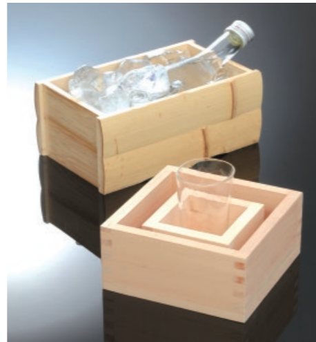
26-221-08 (289078) 冷酒ボックス(スス) ¥5,500 本体寸法: W21xD13xH10cm 竹/ウレタン塗装