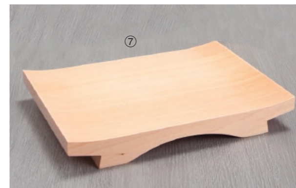
26-222-07 (521537) 檜反り天盛皿 ¥2,800 本体寸法: W21xD15xH3cm 木/ウレタン塗装