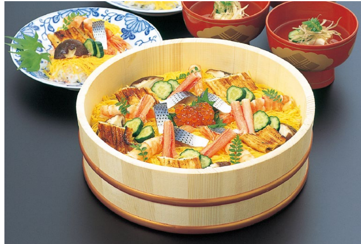
※ 寿司桶のサイズにより、ポリプロピレンタガ・銅タガになります。