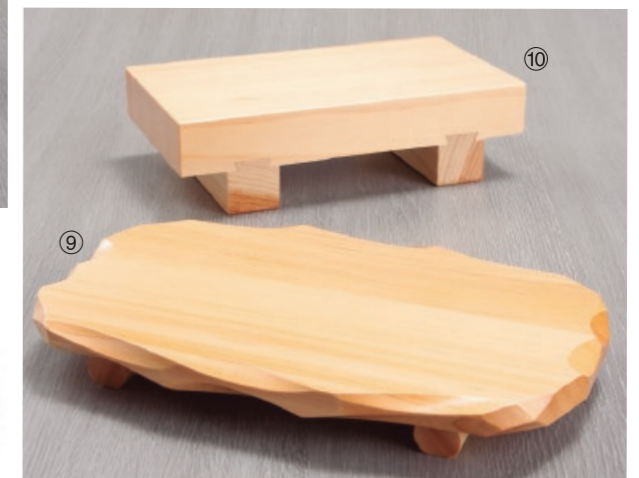
26-222-09 (521539) 檜彫彫刻盛台 ¥3,950 本体寸法: W24xD15xH3cm 木/ウレタン塗装