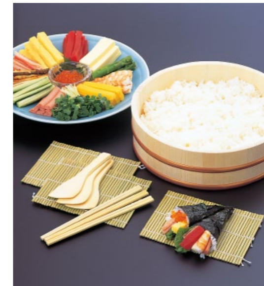
最終加工 日本 ⑦