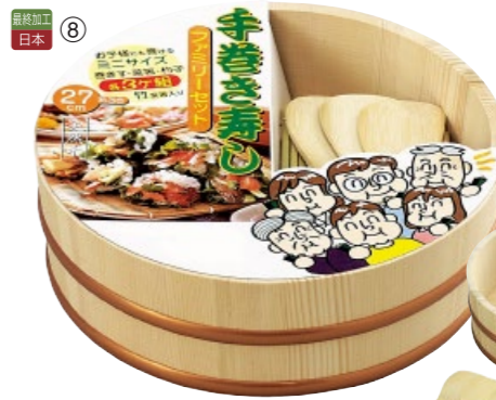
最終加工 日本 ⑧

26-226-08 (522483) 手巻寿司セット (27cm)(A) ¥5,600 本体寸法:約Φ27xH8.8cm 木 ポリプロピレン (しゃもじx3 巻スx3 箸x3)