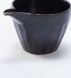
26-221-05 (412463) 木製菊彫片口酒器(根来) ¥2,400 本体寸法: W11.5xD9xH6.8cm 木/漆塗装