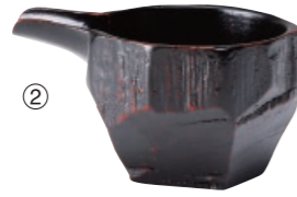
26-221-01 (412375) 木製亀甲片口酒器 (根来)(小) ¥1,950 本体寸法: W9.5xD7xH5cm 木/漆塗装