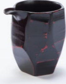
26-221-03 (412465) 木製亀甲片口酒器 (根来)(大) ¥3,800 本体寸法: W11.5xD8.5xH10.5cm 木/漆塗装