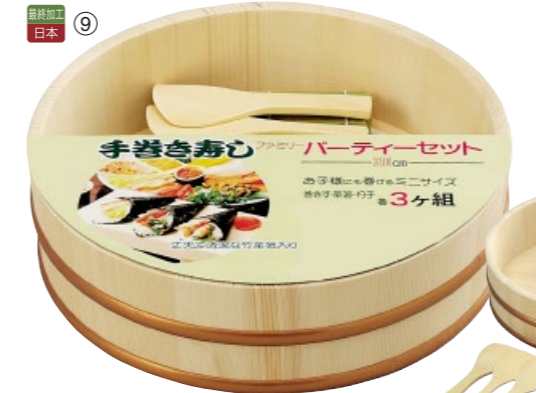
最終加工 日本 ⑨

26-226-09 (522485) 手巻寿司セット(30cm)(A) ¥7,600 本体寸法:約Φ30xH8.8cm 木 ポリプロピレン (しゃもじx3 巻スx3 箸x3)