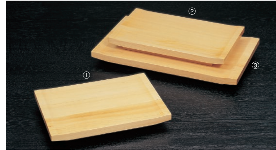
26-222-01 (52673) 檜L型無地盛皿(小) ¥2,800 本体寸法: W21xD15xH3cm 木/ウレタン塗装