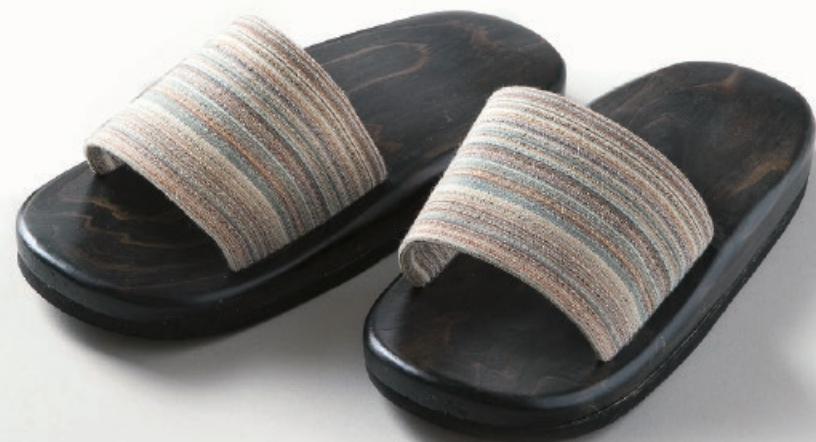
BR-42023200 杉木目塗丸型スリッパ (しじら) 収納ポーチ付 W25xD10.5xH2.3cm

下駄職人がひとつひとつ丁寧に手づくりした杉製のスリッパ。 天然木のやさしい履き心地です。