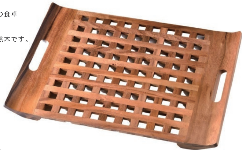
BR-52016530 アカシア格子柄ウッドトレイ (M) W47xD34xH3.5cm

モダンな格子模様がいつもの食卓をスタイルアップ。 味わいのあるアカシアの天然木です。