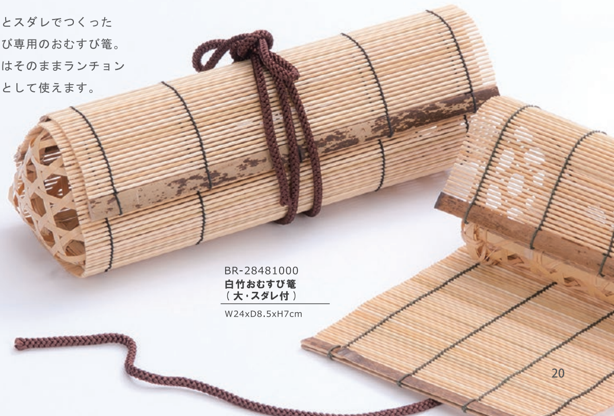
BR-28481000 白竹おむすび籠 (大・スダレ付) W24xD8.5xH7cm

竹編みとスダレでつくったおむすび専用のおむすび籠。スダレはそのままランチョンマットとして使えます。