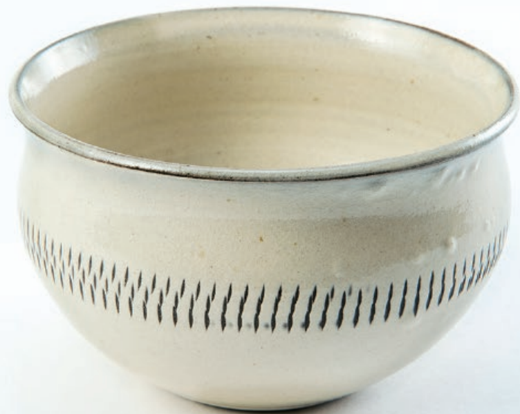
BR-45023590 小鹿田焼カフェオレカップ (白トビ) Φ12.5xH8cm

クリーム色のベースに、トビカンナ模様を施した、とてもシンプルでやさしさ溢れるカフェオレボウル。