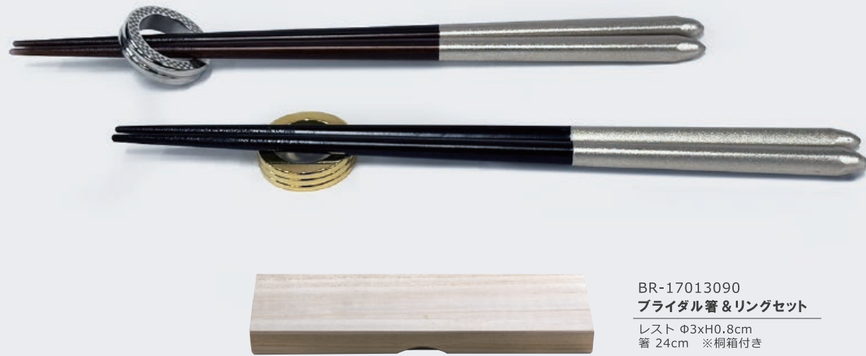
BR-17013090 ブライダル箸&リングセット レスト Φ3xH0.8cm 箸 24cm ※桐箱付き

指輪のような繊細なレストと、手元に箔をあしらったおしゃれな箸のセット。 箸置きは上に置くだけではなく、輪に通してお使いいただけます。