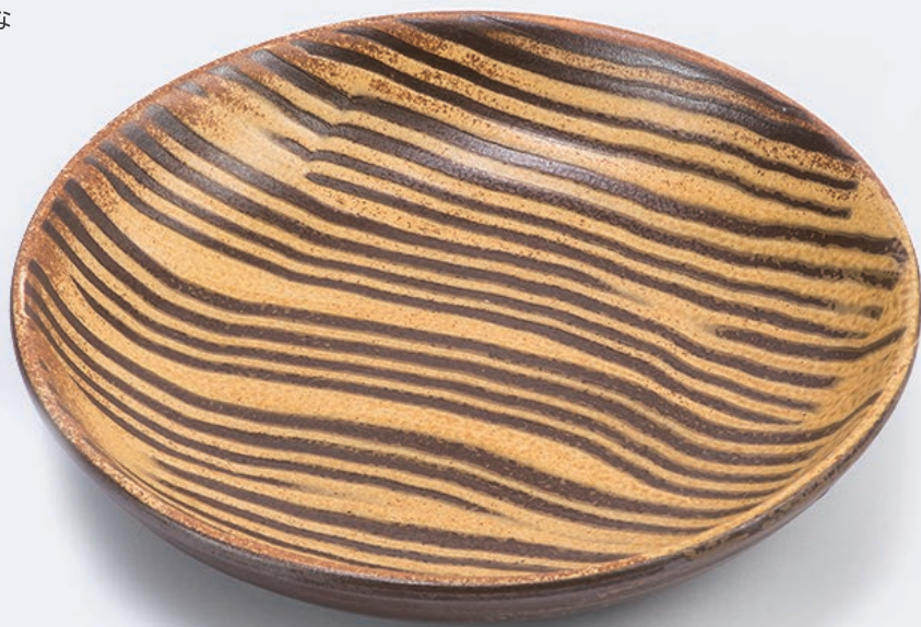
BR-45033555 小石原焼導化釉 カレー皿 Φ21xH4cm

導化釉のさらっとした質感と 刷毛目で表現したゼブラのような 柄がユニークなアイテム。 和にも洋にも合います。