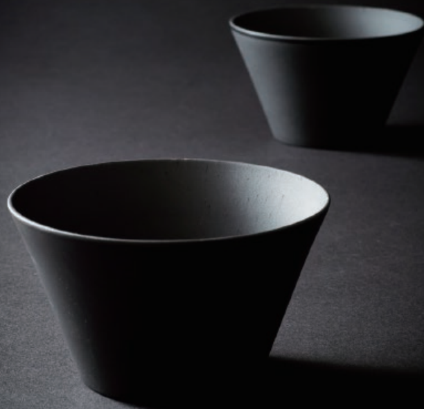
BR-17013050 竹炭塗デザートボウルセット

木製のデザートボウルに竹炭塗を施し、 モダンにデザインしました。 お料理はもちろん、 植物を入れてミニプランター、小物入れ等、 用途は様々です。