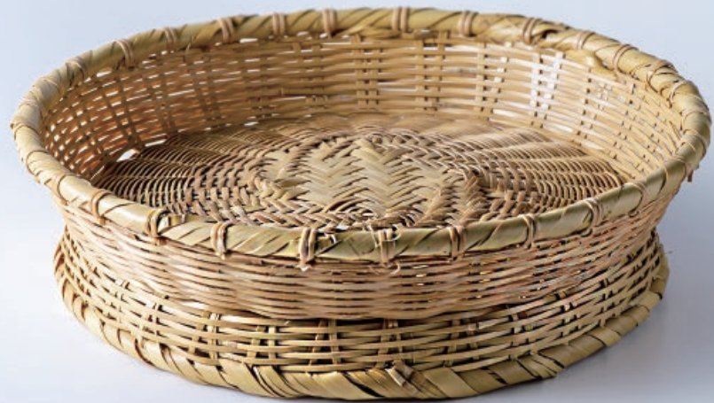
BR-18012200 白竹清涼高台盛器 (8寸) φ24xH6cm

深さのある竹編みの盛籠は、 フルーツやお菓子はもちろん、 中に小鉢を入れて、演出用の 籠として活躍します。