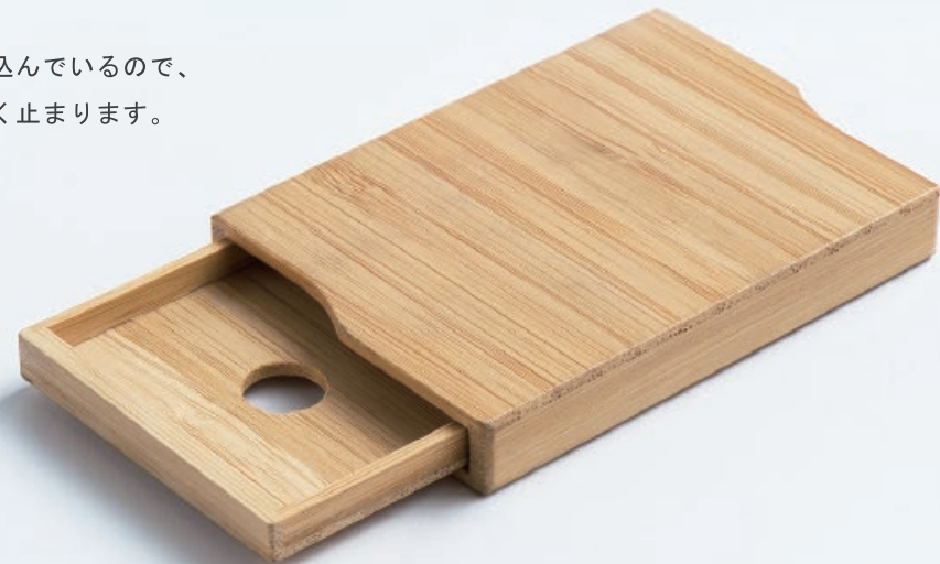
BR-42028800 寄竹名刺ケース W10xD7.2xH1.3cm

モダンな竹の名刺入れ。 内部にはマグネットを組み込んでいるので、 中央部でピタッと気持ち良く止まります。