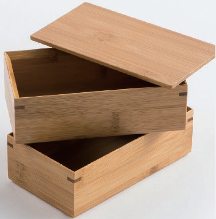
BR-32307000 スス竹長角二段弁当 (仕切 1 個付) W16xD9xH5cm

竹の集成材を丁寧に組み合わせたお弁当箱。 竹は軽く、繊維質なので傷が付きにくいので 未永くご利用いただけます。