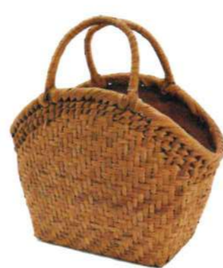
⑥山葡萄8 91429 ¥36,000 W33×D8×H19cm 内布付 網代編み/沢皮