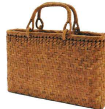
⑬山葡萄S 91472 ¥32,500 W33.5×D12×H20cm 内布付 網代編み/削り皮