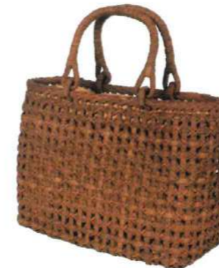
⑦山葡萄バッグ一番皮17M 92481 ¥75,000 W35 × D12 × H26cm 内布付 沢皮/喜祥編み/M