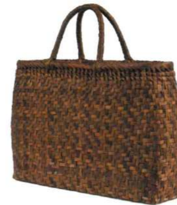
③山くるみ13 91689 ¥40,000 W42×D10×H29cm 内布付 網代編