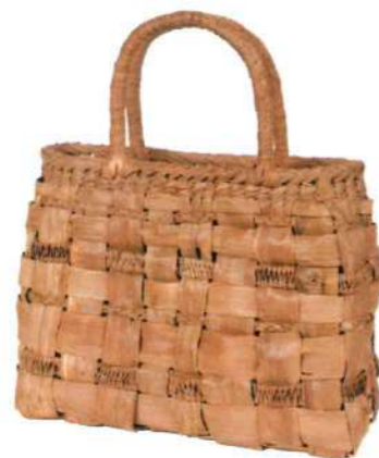
⑥山葡萄バッグLIGHT11 92469 ¥88,000 W34.5 × D10.5 × H22.5cm 内布付 網代網/ジッパー