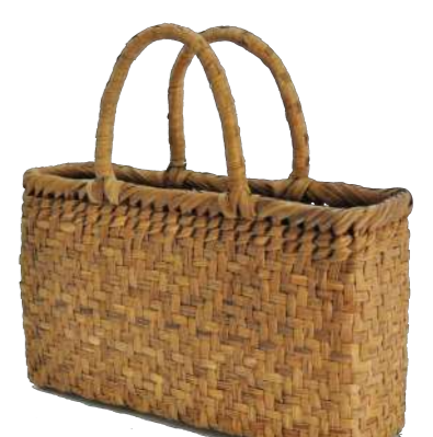
⑱山葡萄12 91510 ¥39,500 W37×D13×H25cm 内布付 網代編み/削り皮