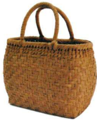
①山葡萄3 91424 ¥36,000 W28×D16×H20cm 内布付 網代編み/沢皮