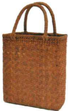
④山葡萄6 91427 ¥40,500 W28×D16×H20cm 内布付 網代編み/沢皮