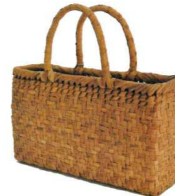
⑩山葡萄2 81468 ¥34,000 W30×D8×H9cm 内布付 網代編み/沢皮