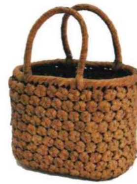
⑥山葡萄1 91458 ¥49,500 W23×D14×H18cm 内布付 六角編み/削り皮