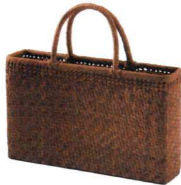
①山葡萄3 91934 ¥87,000 W22×D10×H21cm 内布付 網代編