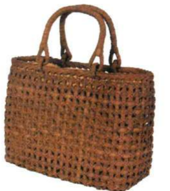
⑥山葡萄バッグ一番皮17L 92480 ¥88,000 W33 × D11 × H24cm 内布付 沢皮/喜祥編み/L