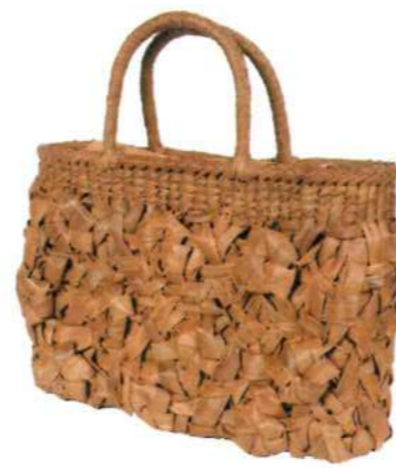
②山葡萄バッグLIGHT7 92465 ¥113,000 W36 × D8 × H25cm 内布付 乱れ六角花編み/被せ布