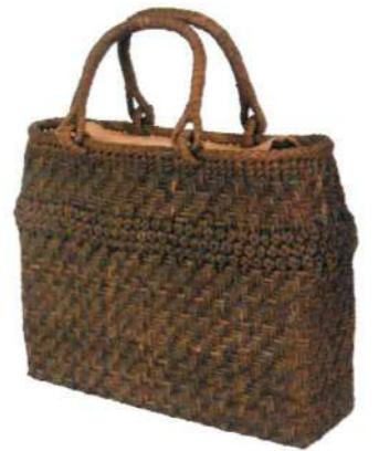
③山葡萄バッグ一番皮15 92477 ¥88,000 W33 × D10 × H24cm 内布付 沢皮/上六角花編み