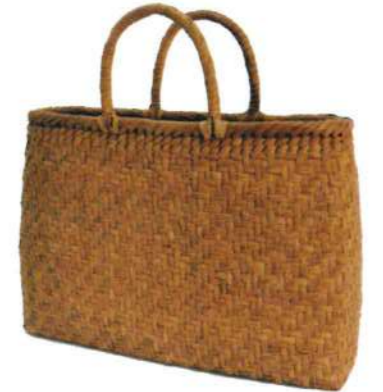
⑫山葡萄13 91511 ¥39,500 W33.5×D12×H20cm 内布付 網代編み/削り皮