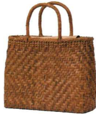
②山葡萄バッグ16116M 92376 ¥43,000 W32×D10×H26cm 網代編み/削り皮