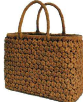
⑤山葡萄4 91421 ¥56,500 W34×D11×H24cm 内布付 六角編み/削り皮