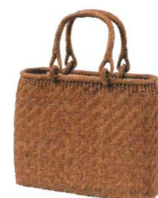
⑭山葡萄バッグ161124 92344 ¥58,000 W27×D9×H23(34)cm 内布付 網代編み/沢皮