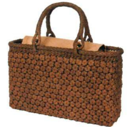
⑬山葡萄バッグー番皮18 92482 ¥125,000 W33.5×D8×H19.5cm 内布付 六角編み/削り皮