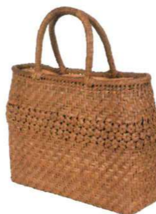
⑧山葡萄バッグLIGHT15 9247 ¥140,000 W33 × 28 × H24cm 内布付 上段六角編み/被せ布