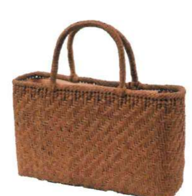
⑮山葡萄バッグ161125M 92345 ¥58,000 W32×D8×H19.5(21)cm 内布付 網代編み/沢皮