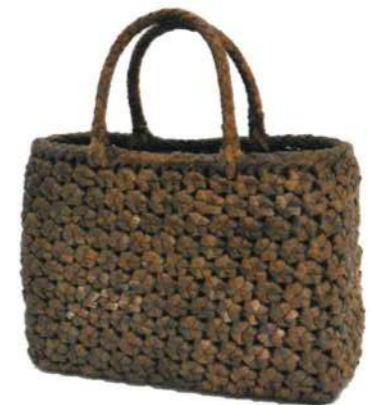
④山くるみ4 91476 ¥52,000 W33×D13×H23cm 内布付 六角編