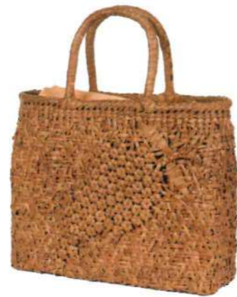
③山葡萄バッグLIGHT8 92166 ¥105,000 W32 × D24.5 × H24.5cm 内布付 山葡萄果実/被せ布