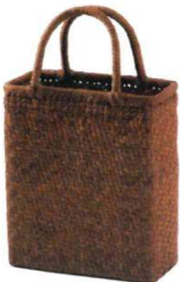
③山葡萄5 91936 ¥87,000 W37×D8×H22cm 内布付 網代編