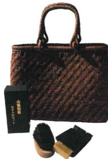
山葡萄籠 お手入れセット ●天然純蜜蝋 ●専用豚毛ブラシ ¥2,500

ご使用頂くうちに山葡萄蔓の繊維にチリやホコリが入り込みますので定期的に専用のブラシでのブラッシングをおすすめいたします。