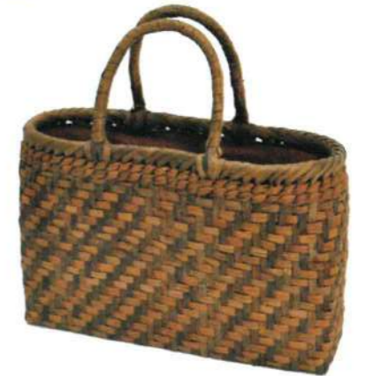
①山くるみ 91475 ¥35,500 W34×D12×H22cm 内布付 網代編