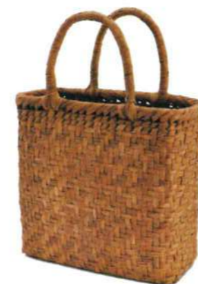
⑨山葡萄5 91449 ¥33,500 W23.5×D8×H23cm 内布付 網代編み/削り皮