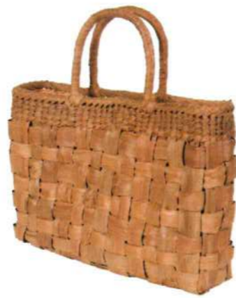
①山葡萄バッグLIGHT6 92464 ¥87,500 W36 × D8 × H23.5cm 内布付 網代編み/巾着

この度山葡萄バッグの軽量化を研究し、およそ30%減量させた商品の開発に努めてまいりました。山葡萄の皮を通常より薄く削ぎ、軽量化させています。