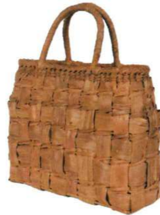
④山葡萄バッグLIGHT9 92467 ¥83,000 W32 × D9 × H24.5cm 内布付 網代網/被せ布