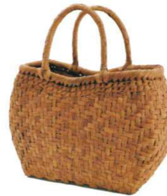
⑯山葡萄10 91508 ¥33,500 W22×D13×H22cm 内布付 網代編み/削り皮