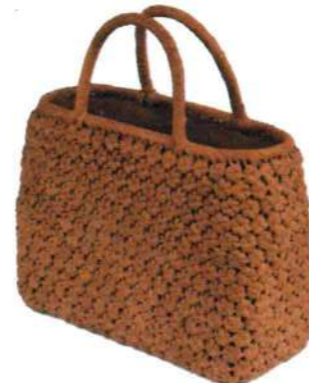
③山葡萄4 91686 ¥85,000 W32×D9×H17cm 内布付 六角編み/削り皮