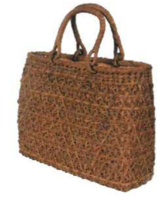
⑨山葡萄バッグ一番皮23 92483 ¥95,000 W32 × D12 × H25cm 内布付 沢皮/菊花編み