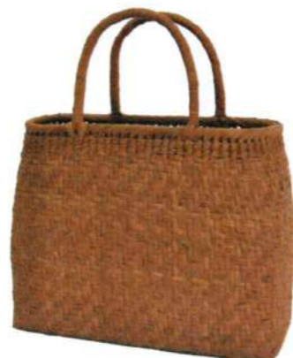
②山葡萄4 91425 ¥40,500 W33×D10×H24cm 内布付 網代編み/削皮