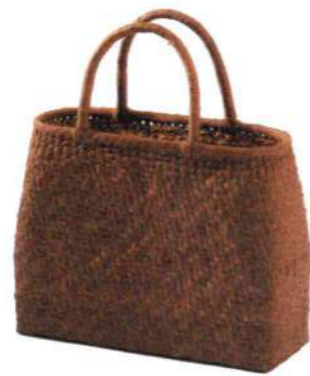
②山葡萄4 91935 ¥117,000 W31×D11×H24cm 内布付 網代編