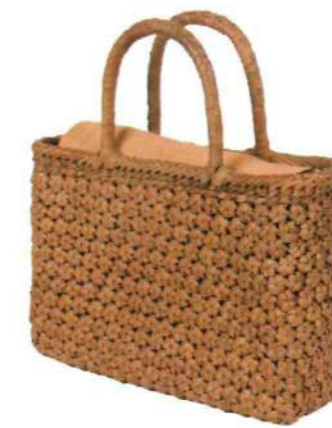
⑩山葡萄バッグLIGHT17 92474 ¥63,000 W35.5 × D9.5 × H25cm 内布付 小六角花編み