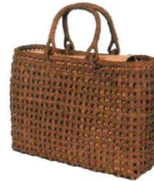
⑤山葡萄バッグ一番皮10S 92479 ¥63,000 W28.5 × D9.5 × H23cm 内布付 沢皮/網代+中間喜祥編み/S