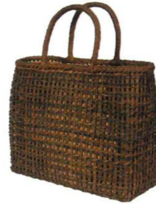
①山葡萄バッグ一番皮8L 92475 ¥63,000 W33.5 × D11 × H26.5cm 内布付 沢皮/松葉編み/L