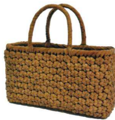
④山葡萄2 91420 ¥49,500 W32×D9×H17cm 内布付 六角編み/削り皮