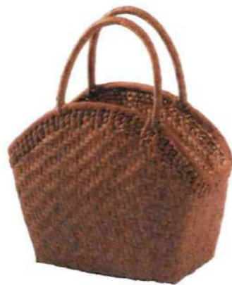
⑤山葡萄8 91938 ¥95,000 W23×D13×H2.54cm 内布付 網代編