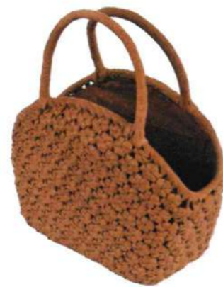
②山葡萄8 91685 ¥90,000 W24×D13×H24cm 内布付 六角編み/削り皮