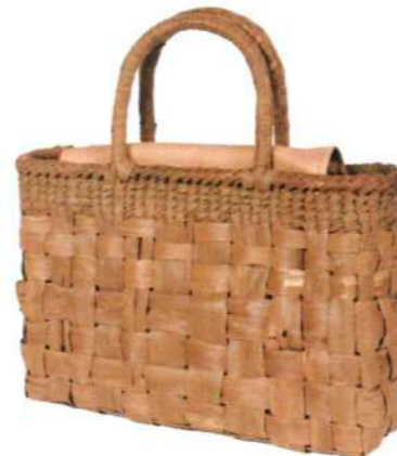
⑤山葡萄バッグLIGHT10 92468 ¥80,000 W31.5 × D7.5 × H21.5cm 内布付 網代網/被せ布