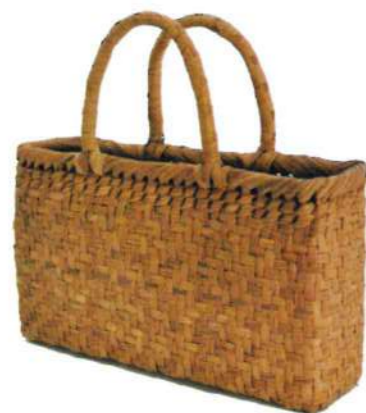
⑦山葡萄6 91461 ¥59,500 W27×D11×H28cm 内布付 六角編み/削り皮