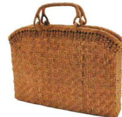
⑭山葡萄D 91473 ¥41,000 W40×D8×H26cm 内布付 網代編み/削り皮