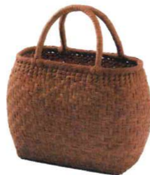
④山葡萄7 91937 ¥114,000 W37×D8×H22cm 内布付 網代編