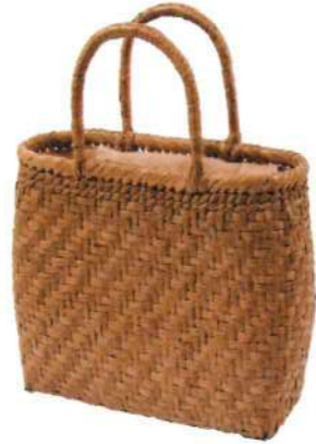
①山葡萄バッグ16116S 92331 ¥35,000 W30×D9×H22cm 網代編み/削り皮