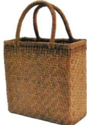
③山葡萄5 91426 ¥37,500 W24×D11×H27cm 内布付 網代編み/削皮