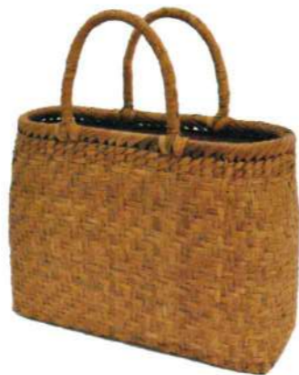
⑤山葡萄4 91418 ¥36,500 W33×D10×H24cm 網代編み/削り皮