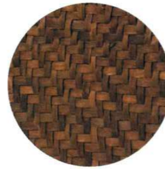
縦ヒゴが山くるみ 横ヒゴが山葡萄