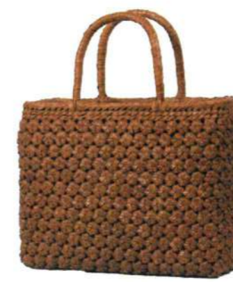
⑫山葡萄バッグ161112S 91463 ¥55,000 W25×D9.5×H7.5cm 内布付 六角編み/削り皮