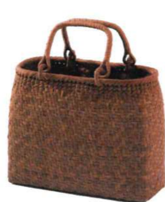
⑨山葡萄4-リング 91440 ¥41,500 W31×D21×H25cm 内布付 網代編み/沢皮