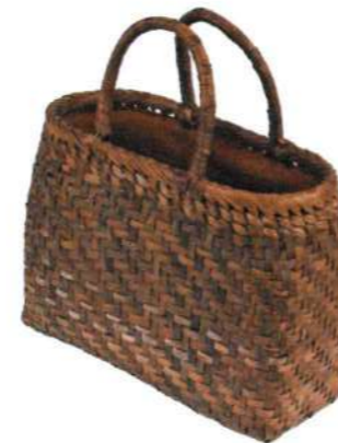
②山くるみ4 91690 ¥40,000 W32×D12×H24cm 網代編