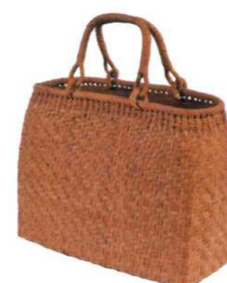
⑬山葡萄4L 91678 ¥50,000 W347×D13.5×H26.5cm 内布付 網代編み/沢皮