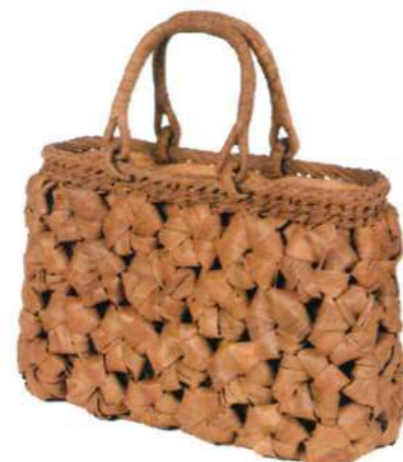
⑦山葡萄バッグLIGHT12 9247 ¥200,000 W34.5 × D10.5 × H22.5cm 内布付 大型六角花編み/巾着