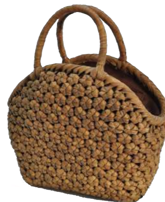
⑨山葡萄8 91463 ¥58,000 W23×D13×H24cm 内布付 六角編み/削り皮