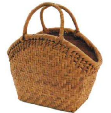
⑮山葡萄8 91507 ¥32,500 W22×D11×H17.5cm 内布付 網代編み/削り皮