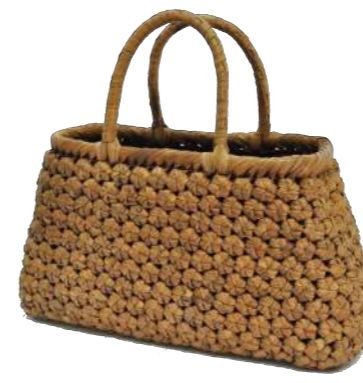
⑪山葡萄9 91464 ¥55,000 W40×D8×H22cm 内布付 六角編み/削り皮