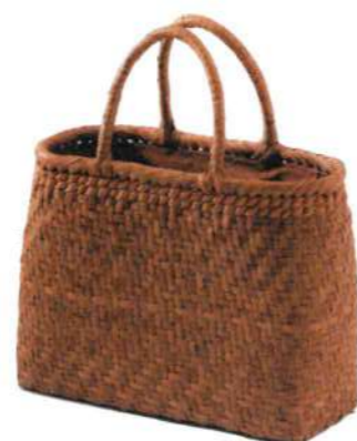
⑧山葡萄4L 91431 ¥43,500 W34×D14×H27cm 内布付 網代編み/沢皮