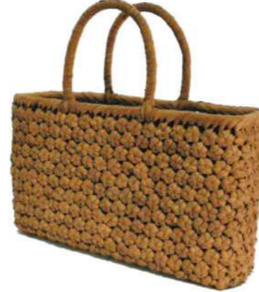
⑧山葡萄7 91462 ¥55,000 W22×D9×H23.5cm 内布付 六角編み/削り皮