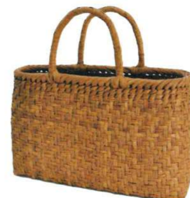
⑰山葡萄11 91509 ¥36,500 W34×D11×H22.5cm 内布付 網代編み/削り皮