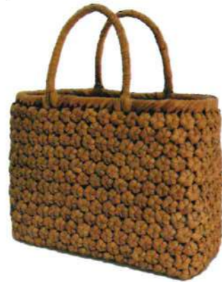
①山葡萄5 91514 ¥55,000 W22×D9×H23.5cm 内布付 六角編み/削り皮