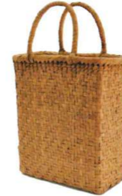
⑩山葡萄6 91450 ¥36,500 W24×D12×H29cm 内布付 網代編み/削り皮