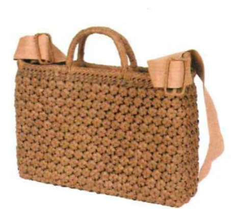
⑪山葡萄バッグLIGHT13 92471 ¥150,000 W31 × D8 × H24cm 内布付 六角花編み/ショルダー