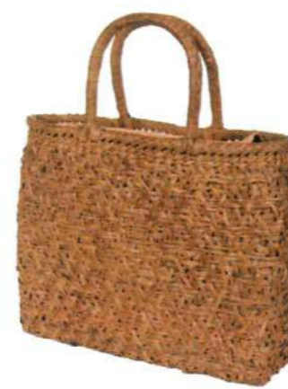
⑨山葡萄バッグLIGHT16 92473 ¥95,000 W28 × D7 × H29.5cm 内布付 乱れ編み