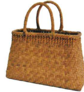
⑪山葡萄9 91452 ¥32,500 W33.5×D12×H20cm 内布付 網代編み/削り皮