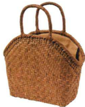
④山葡萄バッグ16117L 92332 ¥40,000 W30×D12×H26cm 網代編み/削り皮