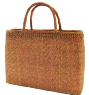
⑫山葡萄13 91470 ¥44,000 W42×D10×H29cm 内布付 網代編み/沢皮