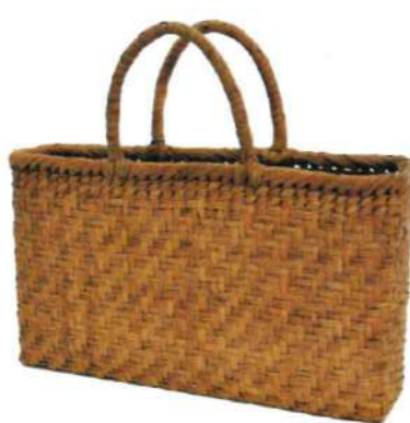
⑤山葡萄7 91428 ¥39,000 W38×D9×H22cm 内布付 網代編み/沢皮