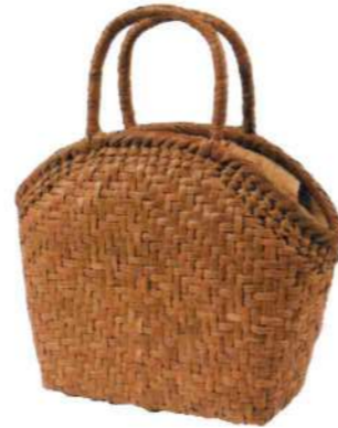
③山葡萄バッグ16117M 92333 ¥35,000 W27×D12×H21cm 網代編み/削り皮