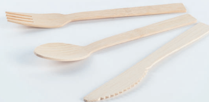
2609120 竹製スプーン (10本セット) 17cm ¥370 2609130 竹製フォーク (10本セット) 16.6cm ¥360 2609140 竹製ナイフ (10本セット) 16.8cm ¥330