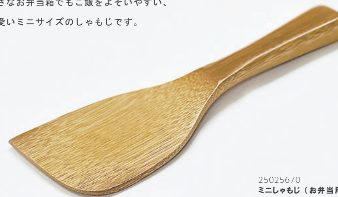
25025670 ミニしゃもじ (お弁当用) W14×D5×H1cm ¥650