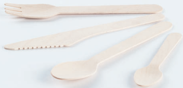
26025600 使い切りスプーン 15.5cm ¥800 26025610 使い切りナイフ 16.5cm ¥600 26025620 使い切りスプーン 15.5cm ¥900 26025630 使い切りデザートスプーン 11cm ¥600