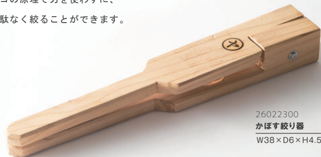
26022300 かぼす絞り器 W38×D6×H4.5cm ¥3,000